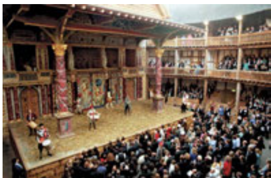
The Globe Theatre, London