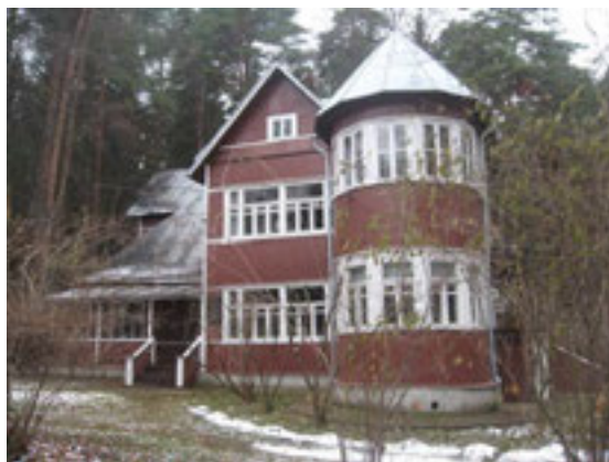
Дом Б. Пастернака в Перedelкино