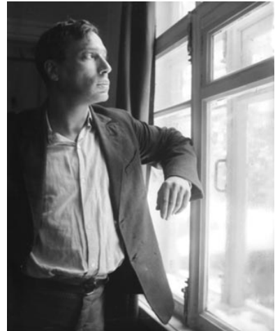
Борис Леонидович Пастернак

Быть или не быть, Вот в чем вопрос. Достойно ль Смиряться под ударами судьбы, Иль надо оказать сопротивление И в смертной схватке с целым морем бед Покончить с ними? Умереть. Забыться. И знать, что этим обрываешь цепь Сердечных мук и тысячи лишений, Присущих телу. Это ли не цель Желанная? Скончаться. Сном забыться. Уснуть... и видеть сны? Вот и ответ. Какие сны в том смертном сне приснятся, Когда покров земного чувства снят? Вот в чем разгадка. Вот что удлиняет Несчастьям нашим жизнь на столько лет. А то кто снес бы униженья века, Неправду угнетателей, вельмож Заносчивость, отринутое чувство, Нескорый суд и более всего Насмешки недостойных над достойным, Когда так просто сводит все концы Удар кинжала! Кто бы согласился, Кряхтя, под ношей жизненной плестись, Когда бы неизвестность после смерти, Боязнь страны, откуда ни один Не возвращался, не склоняла воли Мириться лучше со знакомым злом, Чем бегством к незнакомому стремиться! Так всех нас в трусов превращает мысль, И вянет, как цветок, решимость наша В бесплодье умственного тупика, Так погибают замыслы с размахом, В начале обещавшие успех, От долгих отлагательств.